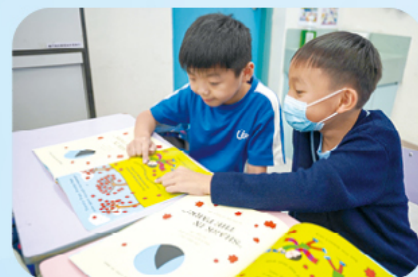
同儕互相觀摩學習