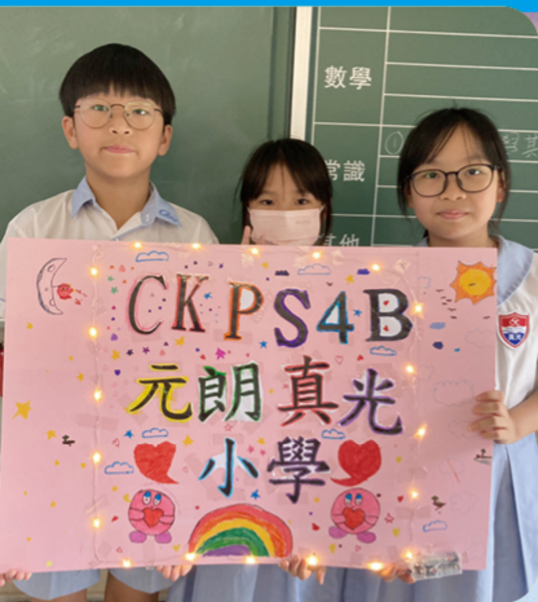
製作不一樣的燈牌

學校每年皆會舉辦 STEAM Day，培養學生的創意與創新精神。為誘發學生的學習興趣，教學團隊特別設計了不同有趣的探究及編程活動，讓學生結合科學、科技、藝術與數學知識，發揮無窮創意，設計出別出心裁、獨一無二的產物。