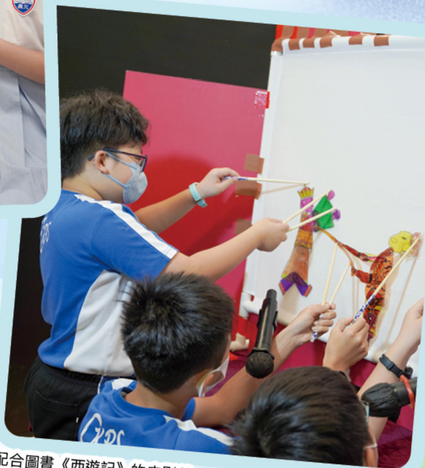
配合圖書《西遊記》的皮影戲

中文科會進行以中華文化為題的跨課程閱讀，內容包括中國經典與發明、中國國粹、中國的傳統節日、中國的習俗等。為鼓勵學生作延伸閱讀，學校會放置繪本，並提供免費電子書，提高學生的閱讀興趣。教學團隊亦活用 Padlet 平台，鼓勵學生以文字和錄音形式，加強學生與故事的互動。