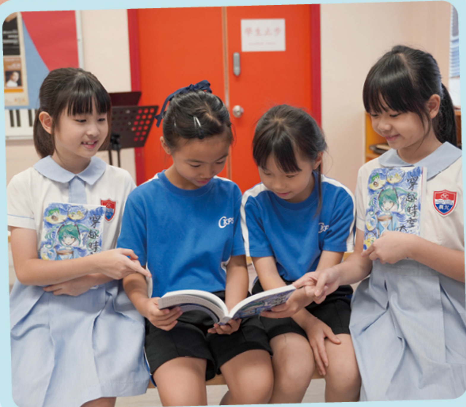
小六學生出版自己的小說

為彌補教科書在閱讀數量、深度上的不足，從上學年開始，學校已將中、英文圖書教學全面推行至各級，融入正規課程，配合單元主題，務求從低小起培養學生的閱讀興趣及習慣。圖書內容循序漸進，先以圖畫為主，隨着學生年齡遞增，增加文字的比例。