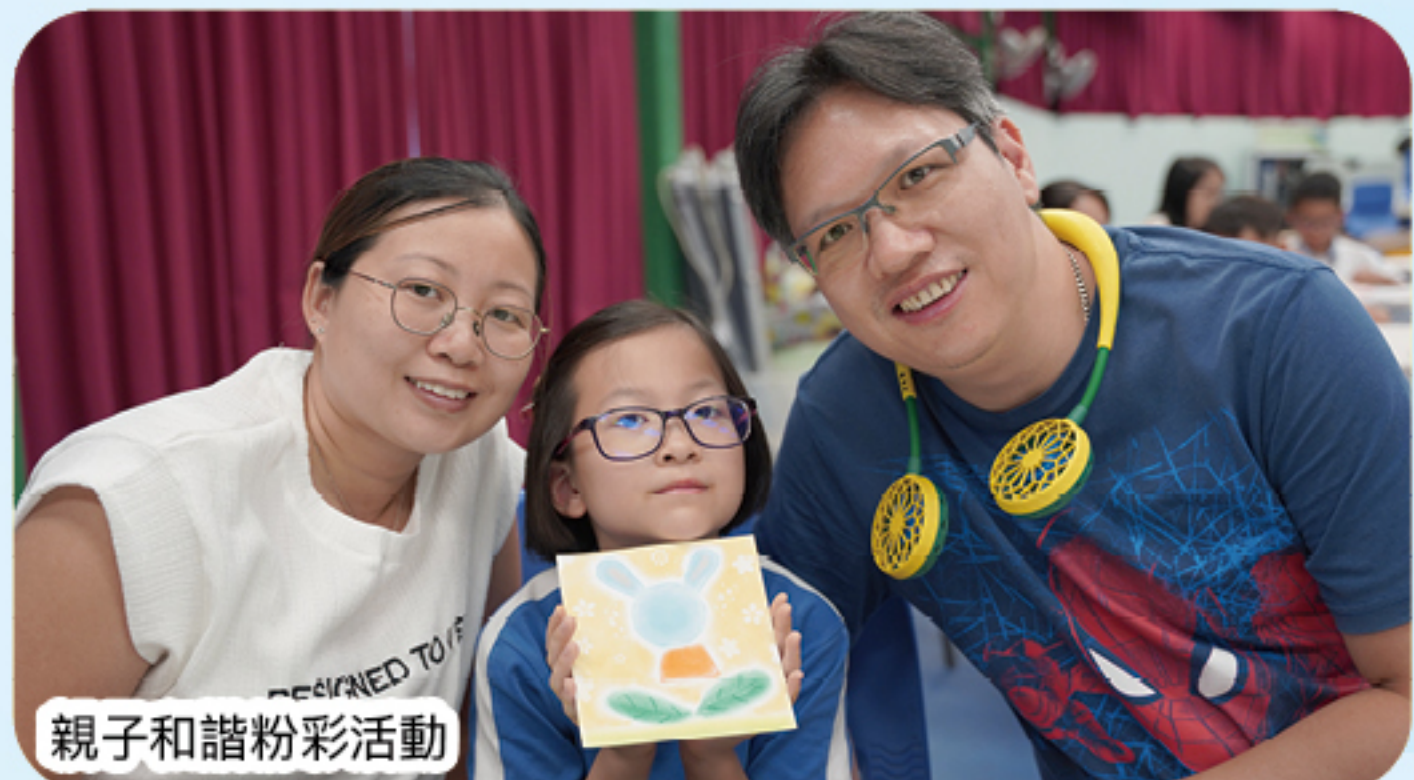
親子和諧粉彩活動