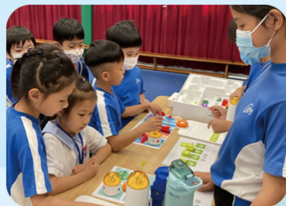
午息編程攤位遊戲