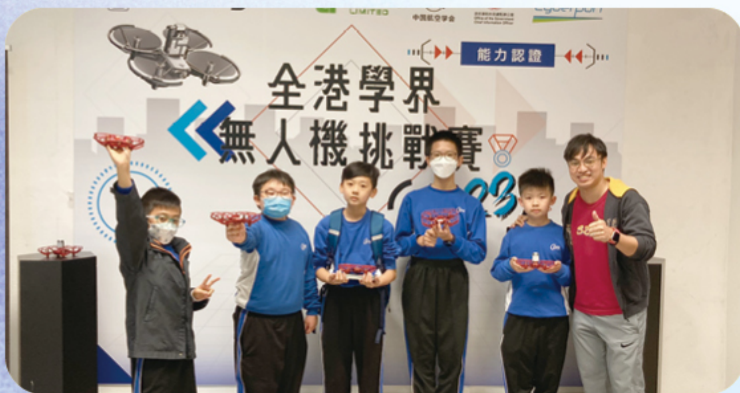
全港學界無人機比賽

學校並沒有忽略資優教育的重要性。學校特別設立創科天地，甄選多位具創科潛能的學生進行資優訓練，成為創科大使。他們除了於校內外推廣 STEAM 活動，更會參與校外大型 STEAM 比賽，在不同的舞台上挑戰自我。