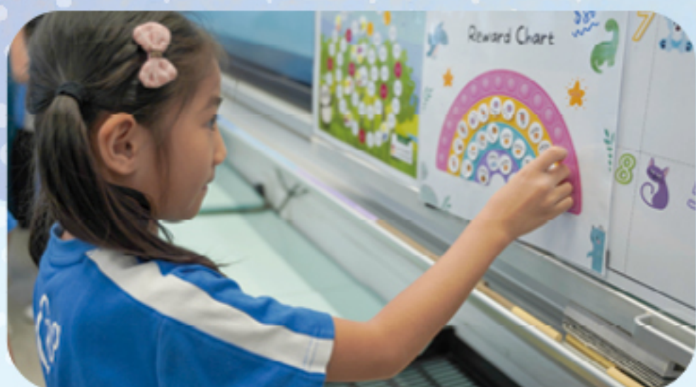
以計分方式獎勵學生