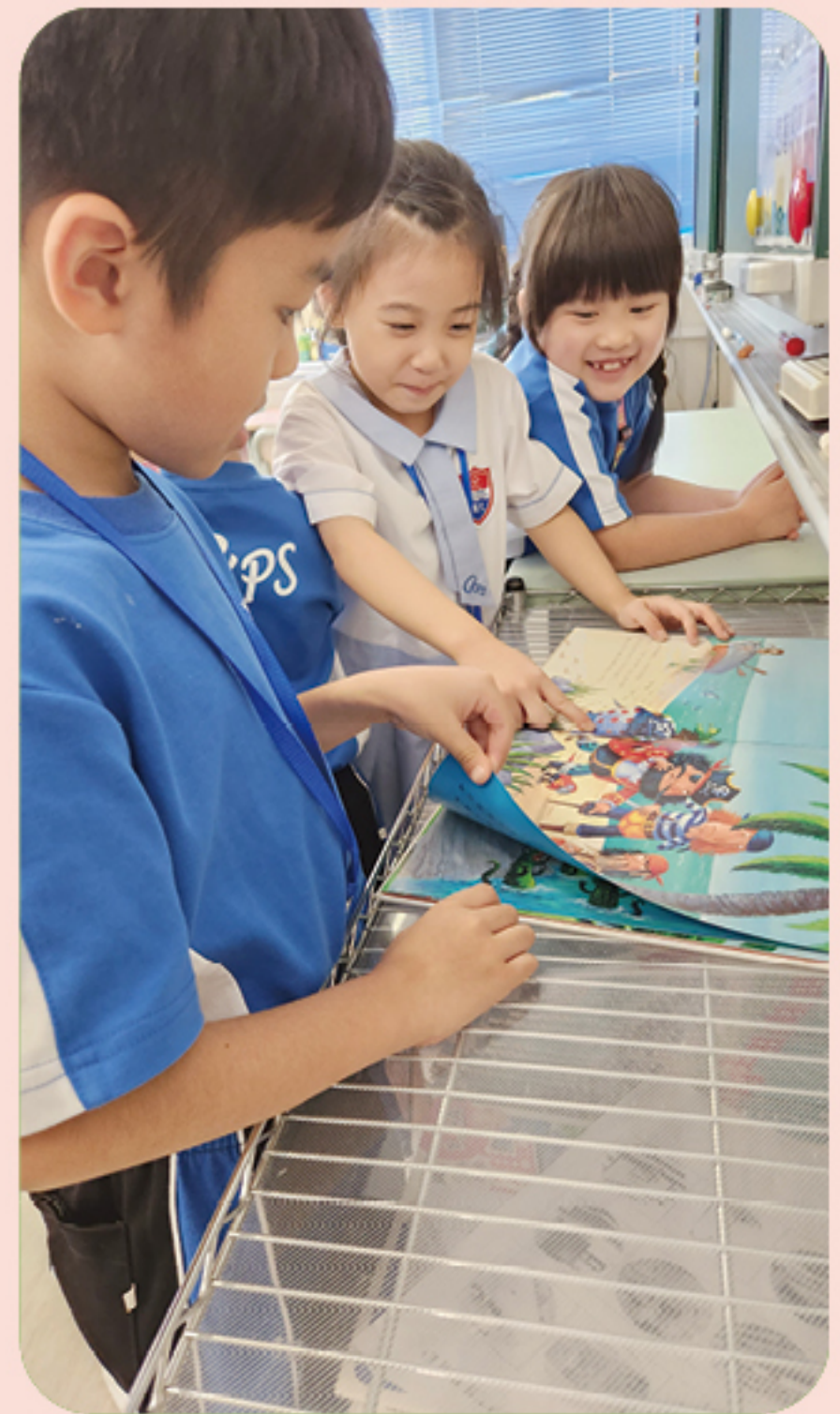
學生按個人興趣，自發進行延伸閱讀