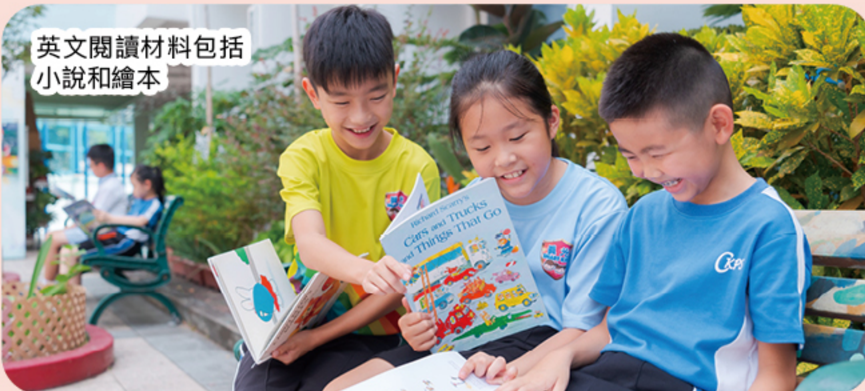
英文閱讀材料包括 小說和繪本

透過提升閱讀深度，學生會進一步自訂閱讀目標，不但在課堂積極投入，亦熱愛課堂以外的閱讀活動。學校於圖書教學的努力廣受好評，英文科團隊更獲教育局邀請，出外分享寶貴心得經驗，為教育工作者作出貢獻。