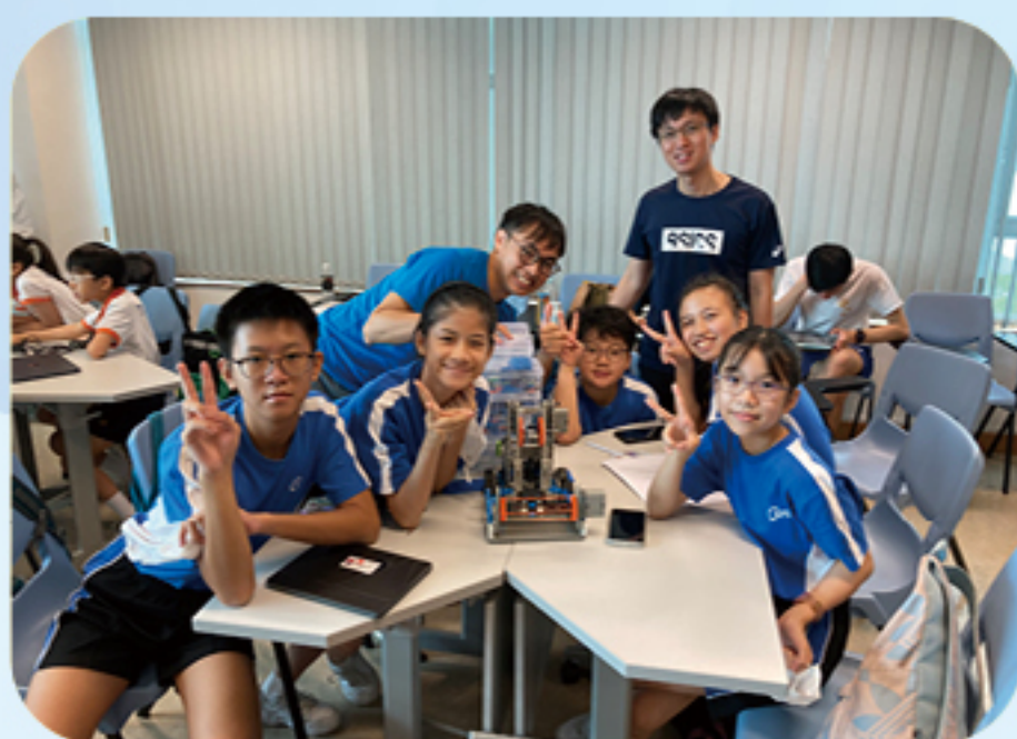
VEX 機械人應用工作坊