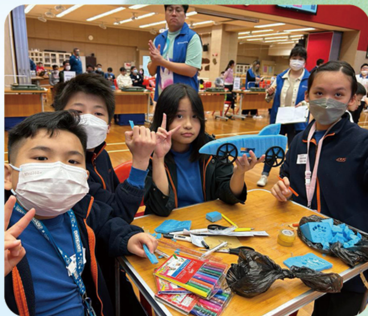
中華基督教會香港區會小學校長會聯校火箭車大賽