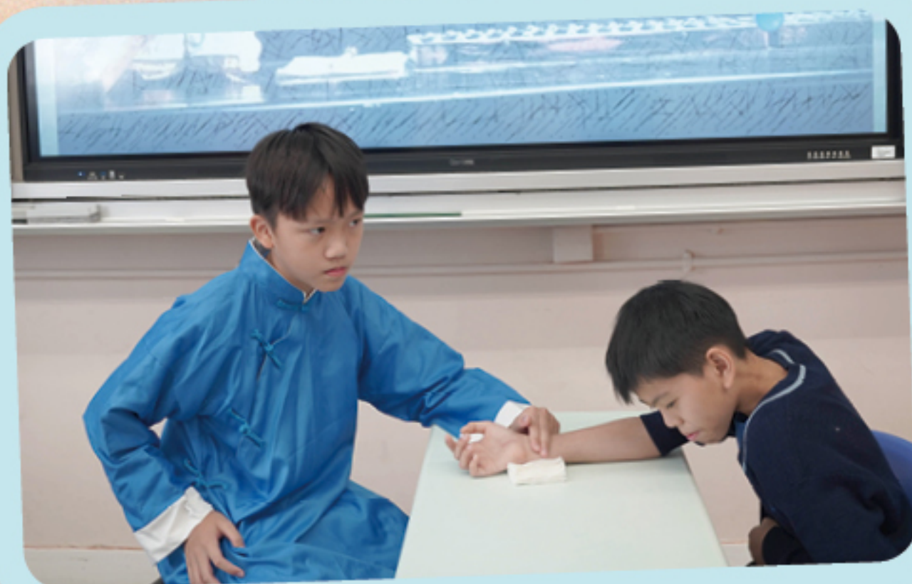
進行以中華文化為題的跨課程閱讀