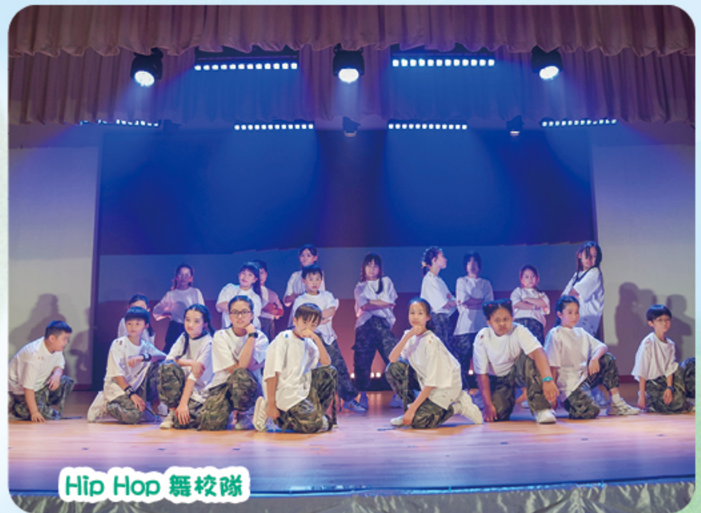
Hip Hop 舞校隊

學校亦一直致力發展 STEAM 教育，近年課外活動引入「STEAM 訓練課程」班、無人機編程班，讓學生有更多的時間接觸科學，學習解難，並安排校隊參與本港不同的編程機械人比賽，吸收更多的經驗學習。