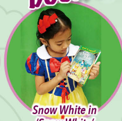
Snow White in 'Snow White'