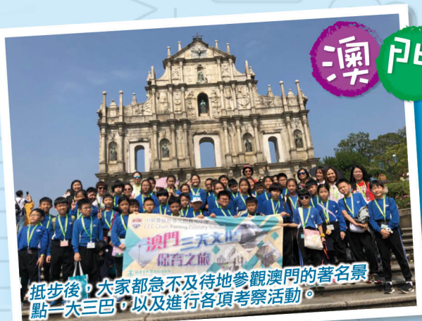
抵步後，大家都急不及待地參觀澳門的著名景點——大三巴，以及進行各項考察活動。

為了擴闊學生的視野，豐富他們的學習經歷，並提升他們對澳門文化保育的認識，學校於去年11月26日至11月28日為五年級學生舉辦了澳門三天文化保育之旅。透過參觀保育景點、實地考察和進行小組匯報等活動，讓學生了解澳門的文化保育工作，也透過三天境外活動，讓學生學習自理和與朋輩協作。