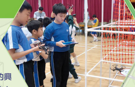
部分資優班及興趣小組學生到校外參加「無人機編程比賽」，以加強運算思維的訓練，亦能增廣見聞。

為豐富學生的學習體驗和增加他們對科技探究的興趣，學校除了在常識課堂中滲入STEM元素外，也會在多元活動學習日為各年級舉辦別具挑戰的STEM活動。各年級學生透過知識建構、實驗及任務解難等不同探索活動體驗STEM的樂趣。本年度學校更增設STEM設計循環五步曲(提出預測、進行實驗、觀察結果、分析結果、作出結論)，讓學生透過體驗完整的科學實驗過程，成為一個勇於嘗試、樂於解難的小小科學家。