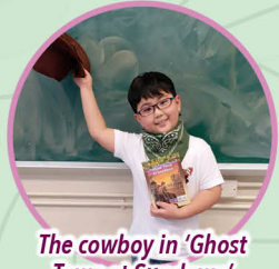
The cowboy in 'Ghost Town at Sundown'