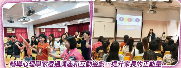
輔導心理學家透過講座和互動遊戲，提升家長的正能量。