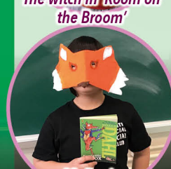
Mr Fox in 'Fantastic Mr Fox'