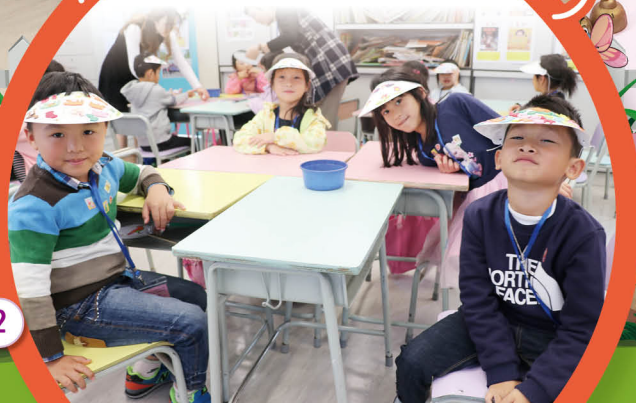
看看我們努力的成果吧！