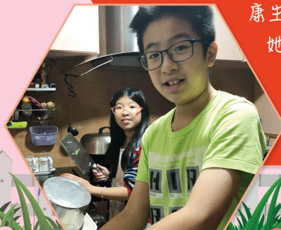
在疫境中分擔家務是理所當然的。

在疫境的日子很忙碌，除了處理學校工作，絞盡腦汁製作網上教材，幫助同學們在停課期間也能掌握學習重點外，還要照顧家中自己孩子的起居飲食，為他們鞏固學習和安排活動；另外，也會擔心需要外出工作的家人，所以感到有壓力。不過，黃老師卻抓緊了這次難得的機會，訓練孩子分配學習、閱讀、運動和玩樂的時間，過有規律的健康生活，培養自律自學的精神；她也透過與孩子齊齊種植，發掘更多溫馨的親子時刻，真是開心啊！