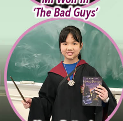
Harry Potter in 'Harry Potter and the Philosopher's Stone'