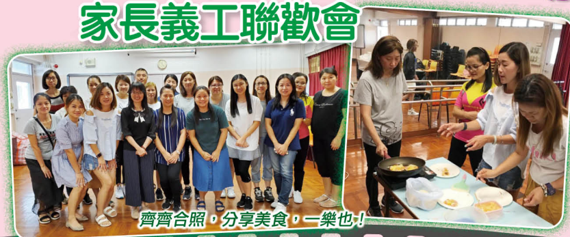
齊齊合照，分享美食，一樂也！