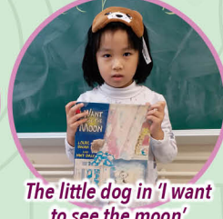
The little dog in 'I want to see the moon'