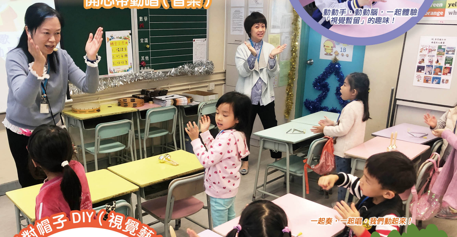
一起奏，一起唱，我們動起來！