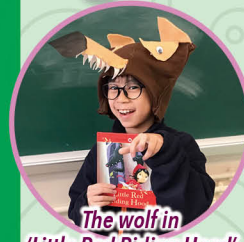
The wolf in 'Little Red Riding Hood'

I hope that more students will join the Book Character Day next year and enjoy reading in their leisure time!