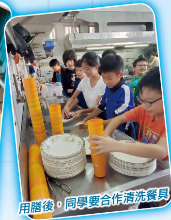
用膳後，同學要合作清洗餐具。