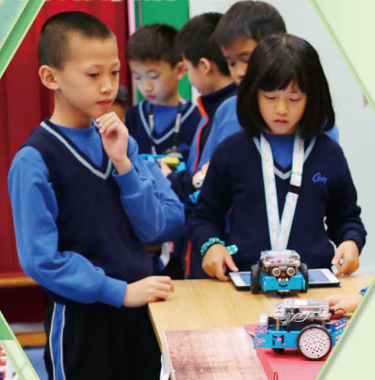
在「多元學習活動日」，學生利用iPad編程控制mBot小車進行「小小真光演奏家」任務。