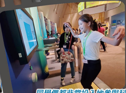
同學們都非常投入地參與科學館內的活動呢！