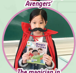
The magician in 'Magic Tricks'