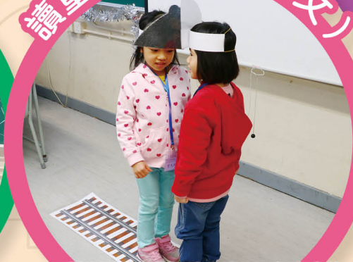
學生透過角色扮演，深入了解童書的內容，並找出解決問題的方法。