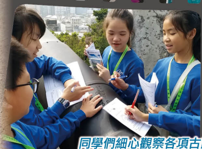
同學們細心觀察各項古蹟，又專心聆聽導賞員講解，並把保育資料記錄在學習冊內。