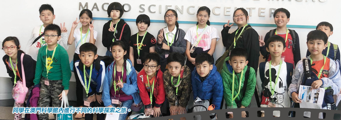
同學在澳門科學館內進行不同的科學探索之旅。

CENTRO DE CIÊNCIA DE MACAU MACAO SCIENCE CENTER