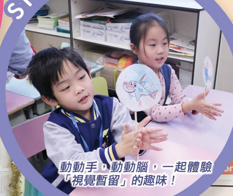
動動手，動動腦，一起體驗「視覺暫留」的趣味！