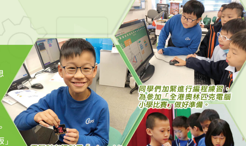
同學們加緊進行編程練習，為參加「全港奧林匹克電腦小學比賽」做好準備。

為提升學生有關編程的知識，發展學生計算思維能力，電腦科於本年度的三至六年級加入編程教學，並在校內外舉辦相關活動，如「mBot小車編程」、「mirco:bit電子板」和「Tello無人機」等，讓學生能夠「動手動腦」，經歷編程學習活動。另外，課後資優班學生嘗試運用「Mirco:bit電子板」製作智能小作品，透過編程解決日常生活的問題。透過以上活動，學生不單能學會編寫程式的技巧，亦能從中了解計算思維的方式，並在過程中學習拆解、模式識別、抽象和演算法的運用。