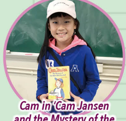
Cam in 'Cam Jansen and the Mystery of the Babe Ruth Baseball'