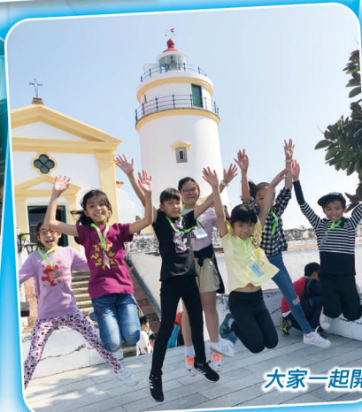
大家一起開心留情影！