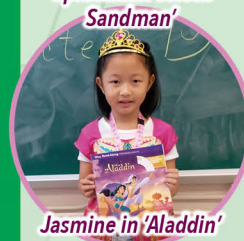
Jasmine in 'Aladdin'