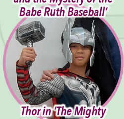
Thor in 'The Mighty Avengers'