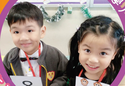
能走動的數學課，真令人開心啊！