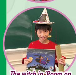
The witch in 'Room on the Broom'