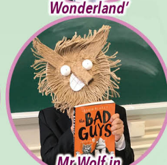
Mr Wolf in 'The Bad Guys'