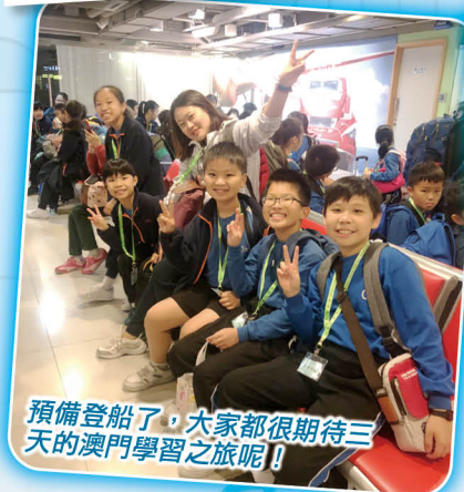
預備登船了，大家都期待三天的澳門學習之旅呢！