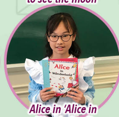
Alice in 'Alice in Wonderland'