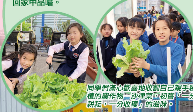
同學們滿心歡喜地收割自己親手種植的農作物「沙律菜」，初嘗「一分耕耘，一分收穫」的滋味。

健康大使透過工作坊和種植班的學習，除掌握了基本的種植知識外，更有機會親身參與翻土、播種、澆水、收割及製作防鳥器等農務工作，最後他們更能把親手種植的沙律菜帶回家品嚐。