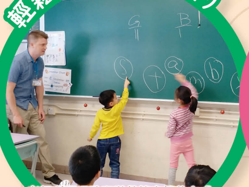
老師利用唱歌和遊戲等有趣的方式，讓學生掌握英文語音知識。