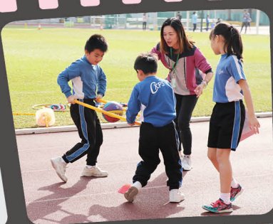
同學們，加油！家長義工支持你！