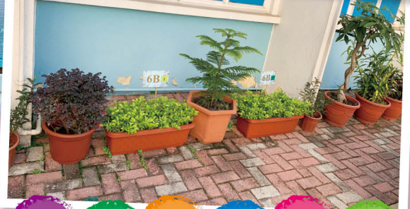
校園內種類多樣化的植物，令學校充滿生氣，對學子的身心均帶來益處。