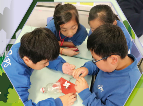
四年級學生很努力地改良他們的「迷你吸塵機」，希望可以增強「吸塵」效能呢！