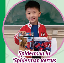
Spiderman in 'Spiderman versus Sandman'