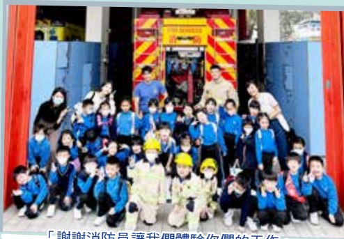
「謝謝消防員讓我們體驗你們的工作。」