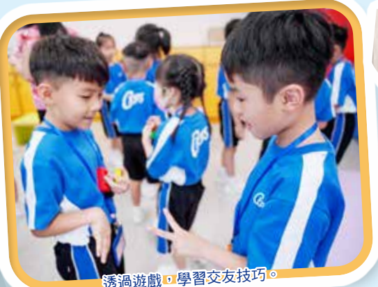
透過遊戲，學習交友技巧。