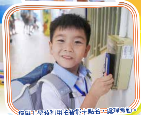
模擬上學時利用拍智能卡點名，處理考勤。