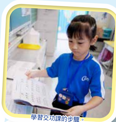
學習交功課的步驟。