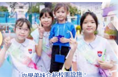
向學弟妹介紹校園設施。