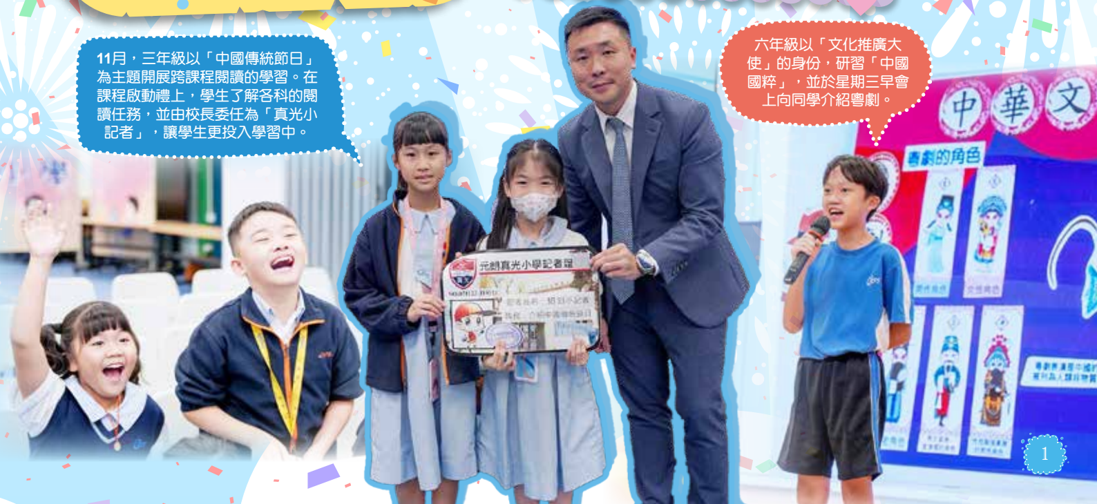
六年級以「文化推廣大使」的身份，研習「中國國粹」，並於星期三早會上向同學介紹粵劇。