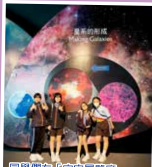
同學們在「宇宙展覽廳」中一同探索宇宙的奧秘！