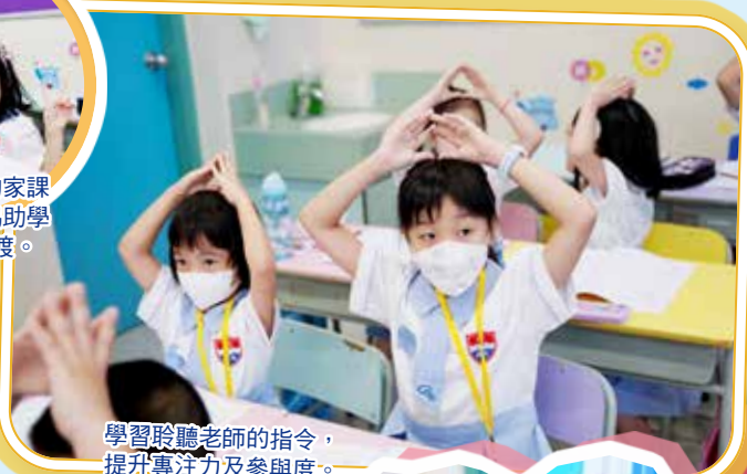
學習聆聽老師的指令，提升專注力及參與度。