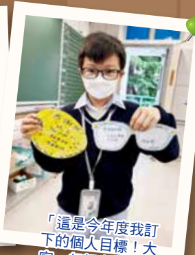
「這是今年度我訂下的個人目標！大家一起努力吧！」