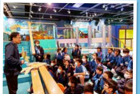
導賞員向同學講解生物的多樣性和介紹「香江童玩」展覽，並示範中國傳統小玩意。