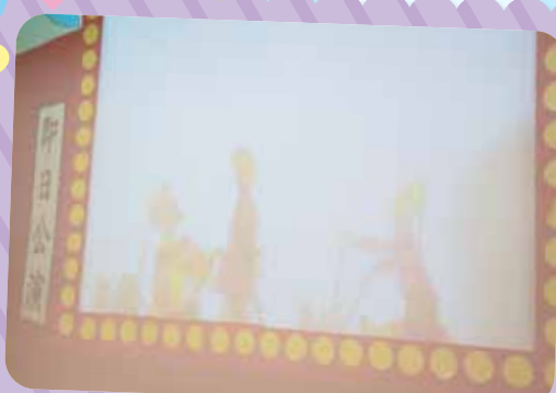
去年，五年級的學生以皮影戲演繹中國的經典名著《西遊記》的選段。