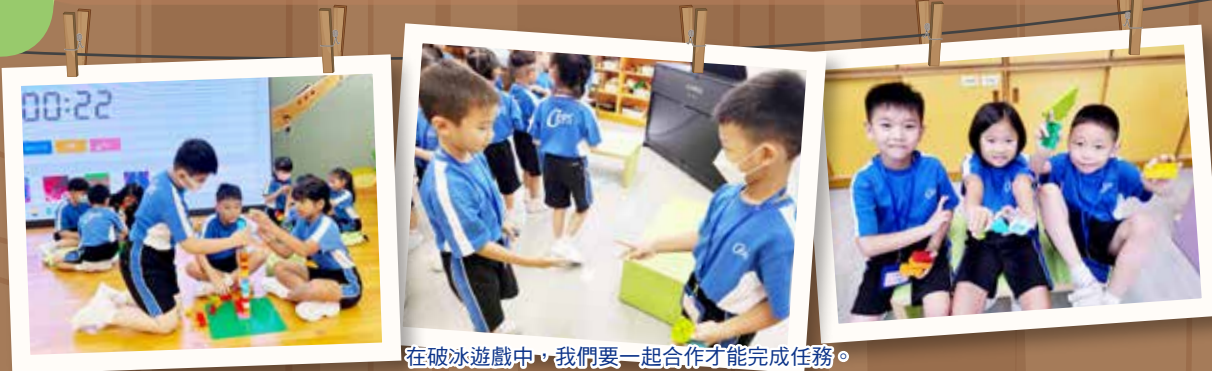
在破冰遊戲中，我們要一起合作才能完成任務。

透過多元化的活動，盼望同學能持續在不同範疇建立良好的習慣，勇於面對挑戰、克服困難，開展豐盛且精彩的校園生活。