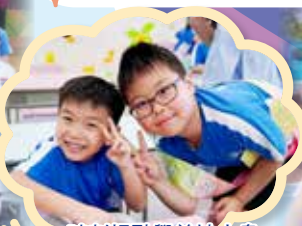
時刻提點學弟妹小息時須注意的事項。