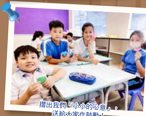
摺出我們「小小的心意」，送給大家作鼓勵！