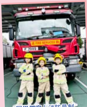
同學們穿上消防員制服顯得特別神氣呢！