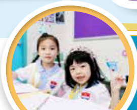
利用放大版的家課冊寫功課，協助學生適應與過渡。

小學是孩童正式進入學習的成長階段，為了讓學生儘快適應小學的學習生活，學校舉行了「小一適應日」，透過多元化的活動，滲入不同的課室常規訓練，讓學生及早適應校園環境，學習如何交友及與人相處，建立良好社交態度，並教授他們自理技巧，以裝備學生適應小學生活，從活動中提升其專注力，從而建立學習信心，為踏入多姿多采的小一校園生活做好準備。