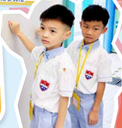
學習做個有禮的真光好孩子。