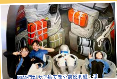
同學們對太空航天部分最感興趣，爭相體驗航天員在太空艙的生活！原來太空的無重生活一點都不簡單啊！