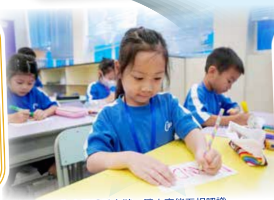
為自己設計名牌，讓大家能互相認識。