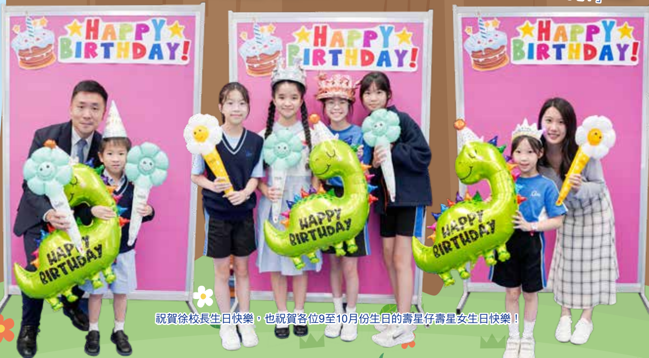
祝賀徐校長生日快樂，也祝賀各位9至10月份生日的壽星仔壽星女生日快樂！