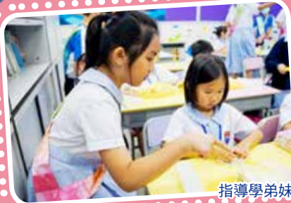
指導學弟妹完成「膳」後工作。