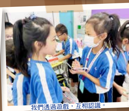
我們透過遊戲，互相認識。