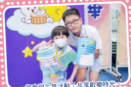
一起參與午息活動，共享歡樂時光。