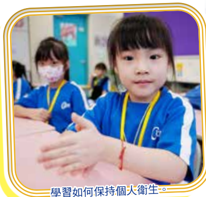
學習如何保持個人衛生。